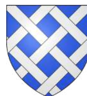
Commune de Drucat