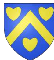
Commune de Friville